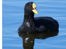
Tagua Común Fulica armillata