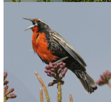
Loica Sturnella loyca