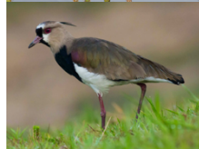
Queltehue Vanellus chilensis