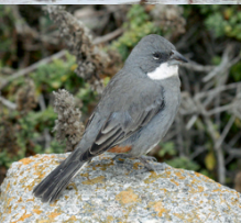
Diuca Diuca diuca