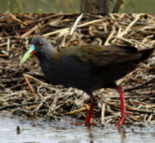
Pidén Pardirallus sanguinolentus