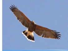
Peuco Parabuteo unicinctus