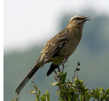
Tenca Mimus thenca