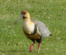
Bandurria Theristicus melanopis