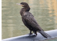
Yeco Phalarocarus brasilianus