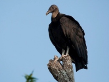
Jote Cabeza Negra Caragyps atratus