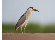
Huairavo Nycticorax nycticorax