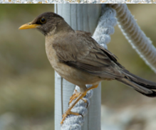
Zorzal Turdus falcklandii