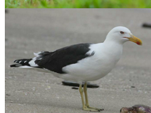
Gaviota Dominicana Larus dominicanus