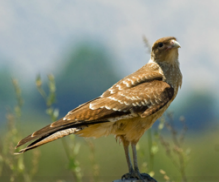
Tiuque Milvago chimango