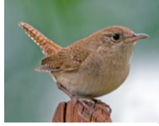
Saltapared Común (Cucarachero común) Troglodytes aedon