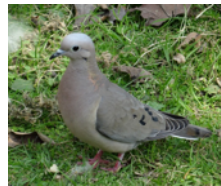
Torcaza (Paloma Torcaza) Zenaida auriculata