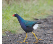
Gallineta Morada (Tingua azul) Porphyrio martinica