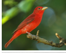
Piranga Roja (Tangara Veranera) Piranga rubra