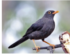
Paraulata Morera (Mirla Patianaranjada) Turdus fuscater