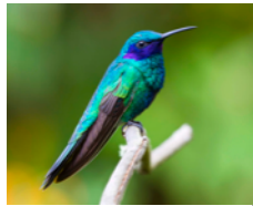
Colibrí Grande (Colibrí chillón) Colibri coruscans