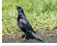
Tordo Sudamericano (Chamón) Molothrus bonariensis