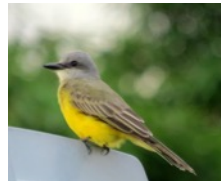
Tirano Pirirí (Sirirí) Tyrannus melancholicus