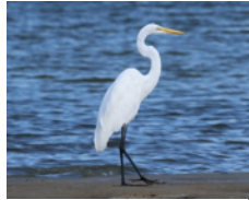
Garza Blanca (Garza Real) Ardea alba

- Tus observaciones ayudan a que entendamos las poblaciones de aves de tu región.