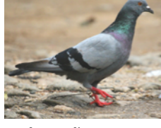
Paloma Doméstica Columba livia