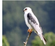
Milano Cola Blanca (Gavilan Bailarín, Maromero) Elanus leucurus