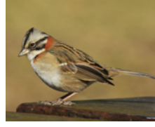
Gorrión Chingolo (Copetón) Zonotrichia capensis