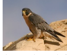
Halcón Peregrino Falco peregrinus