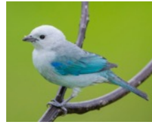
Tangara Azulgris (Azulejo) Thraupis episcopus