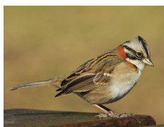
Chincol Rufous-collared Sparrow Zonotrichia capensis