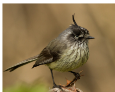
Cachudito Tufted Tit-Tyrant Anairetes parulus

- Tus observaciones ayudan a que entendamos las poblaciones de aves de tu región.