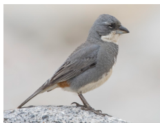
Diuca Common Diuca-Finch Diuca diuca