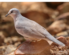
Tortolita Cuyana Picui Ground Dove Columbina picui