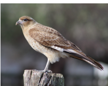
Tiuque Chimango Caracara Milvago chimango