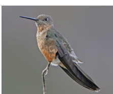
Picaflor Gigante Giant Hummingbird Patagona gigas