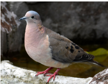
Tórtola Eared Dove Zenaida auriculata