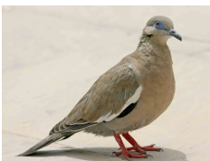
Paloma de Alas Blancas West Peruvian Dove Zenaida meloda