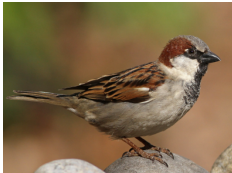
Gorrión House Sparrow Passer domesticus