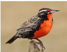
Loica Long-tailed Meadowlark Leistes loyca