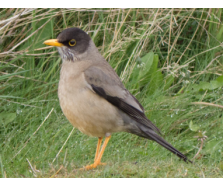
Zorzal Austral Thrush Turdus falcklandii