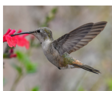
Picaflor del Norte Oasis Hummingbird Rhodopsis vesper