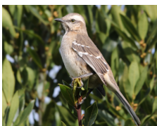
Tenca Chilena Chilean Mockingbird Mimus thenca