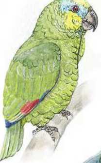
Loro Guaro (Amazona amazonica)