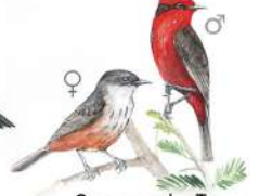
Sangre de Toro (Pyrocephalus rubinus)