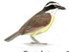
Cristofué (Pitangus sulphuratus)