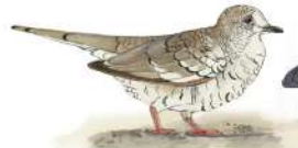
Palomita Maraquito (Columbina squamata)