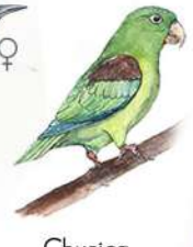
Churica (Brotogeris jugularis)