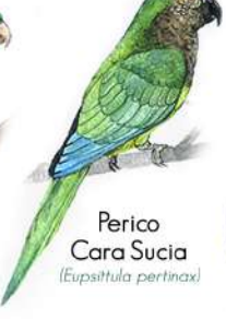
Perico Cara Sucia (Eupsittula pertinax)