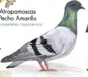
Paloma Doméstica (Columba livia)