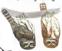
Pavita Ferrugínea (Glucidium brasiliannum)