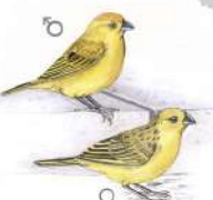
Canario de Tejado (Sicalis flaveola)

Ilustración: Josmar Esteban Marquez - Instagram: @birdnaturalfart Todos los Derechos Reservados AveZona - Instagram: ave_zona