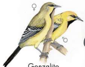
Gonzalito (Icterus nigrogularis)