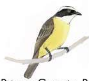
Pitirre Copete Rojo (Myiozetetes similis)