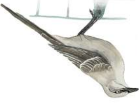
Reinita (Coereba flaveola)