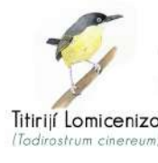
Titirijí Lomicenizo (Todirostrum cinereum)