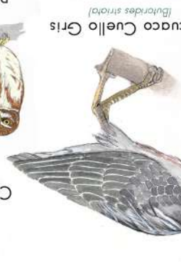
Chicuaco Cuello Gris (Fulvicae striata)