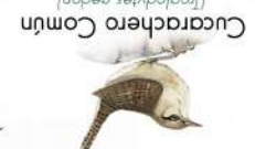
Cucarachero Común (Trogodytes aedon)