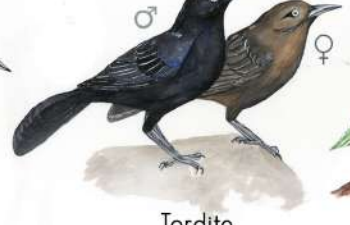
Tordito (Quiscalus lugubris)