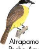
Atrapamoscas Pecho Amarillo (Myiozetetes cayanensis)