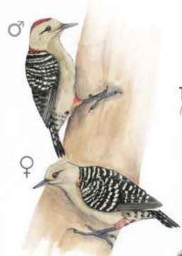
Carpintero Habado (Melanerpes rubicapillus)