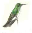
Diamante Gargantiverde (Amazilia limbriata)