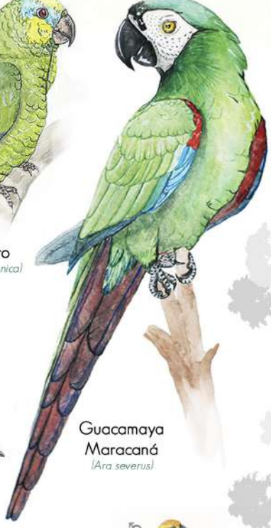
Guacamaya Maracaná (Ara severus)