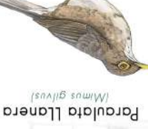
Parulata Llanera (Mimus gilvus)