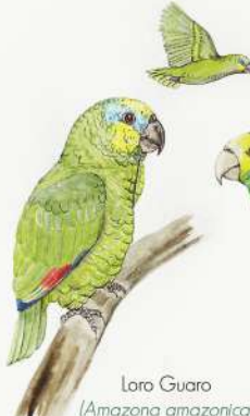
Loro Guaro ( Amazona amazonica )