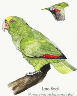
Loro Real ( Amazona ochrocephala )