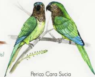
Perico Cara Sucia ( Eupsittula pertinax )