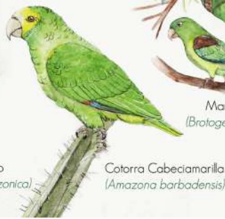
Cotorra Cabeciamarilla ( Amazona barbadensis )